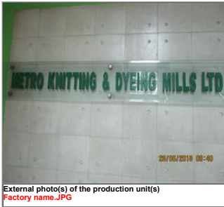
External photo(s) of the production unit(s) Factory name.JPG