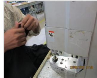
Photo of non-conformity Finger guard missing at snap button machine.JPG