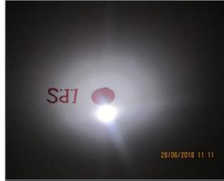
Photo of the inside of the main production hall Emergency light.JPG