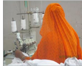
Photo of non-conformity Eye guard displaced at over lock machine.JPG