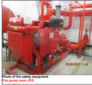
Photo of fire safety equipment Fire pump room.JPG