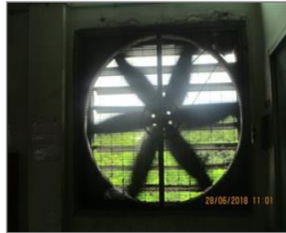
Photo of the inside of the main production hall Exhaust fan.JPG