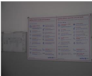
Photo of the code of conduct on display Amfori BSCI COC posted.JPG