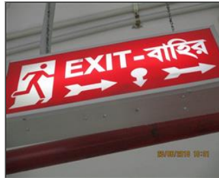
Photo of the inside of the main production hall Exit sign.JPG