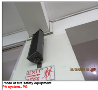
Photo of fire safety equipment PA system.JPG