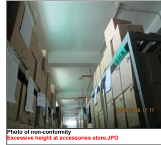
Photo of non-conformity Excessive height at accessories store.JPG