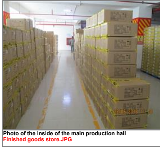
Photo of the inside of the main production hall Finished goods store.JPG