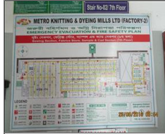
Photo of the inside of the main production hall Evacuation plan.JPG