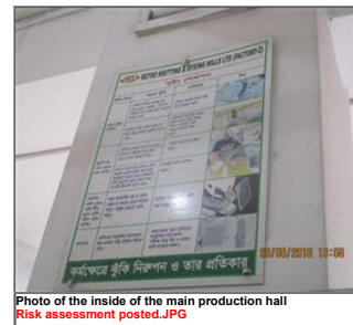
Photo of the inside of the main production hall Risk assessment posted.JPG