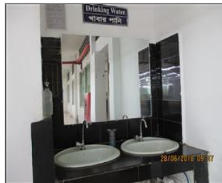
Photo of the inside of the main production hall Drinking water.JPG