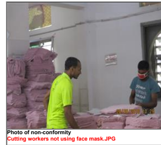
Photo of non-conformity Cutting workers not using face mask.JPG