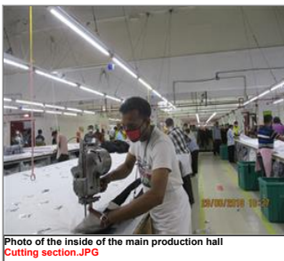
Photo of the inside of the main production hall Cutting section.JPG