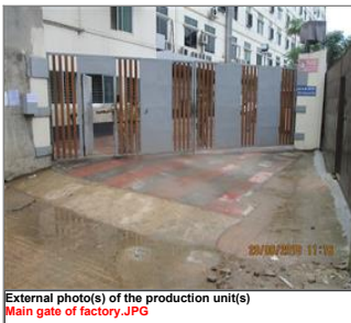
External photo(s) of the production unit(s) Main gate of factory.JPG