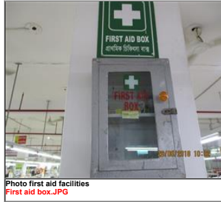
Photo first aid facilities First aid box.JPG