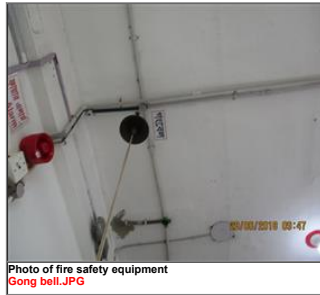
Photo of fire safety equipment Gong bell.JPG