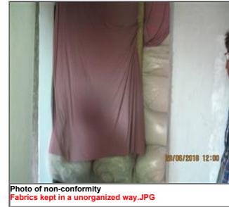
Photo of non-conformity Fabrics kept in a unorganized way.JPG