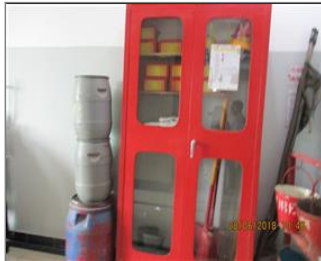
Photo of fire safety equipment Fire fighting equipment.JPG