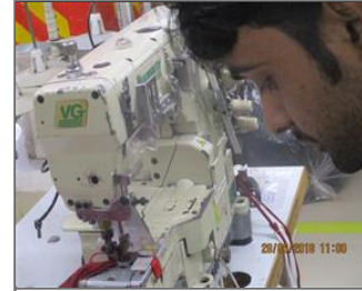
Photo of non-conformity Eye guard displaced at flat lock machine.JPG