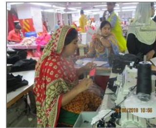
Photo of non-conformity Overlock operator not using face mask.JPG