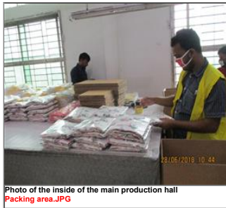
Photo of the inside of the main production hall Packing area.JPG