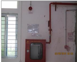
Photo of fire safety equipment Fire hose cabinet.JPG