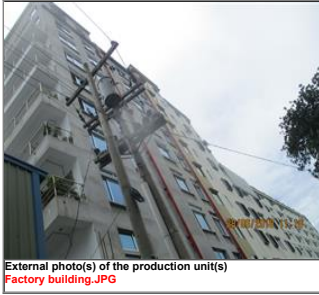
External photo(s) of the production unit(s) Factory building.JPG