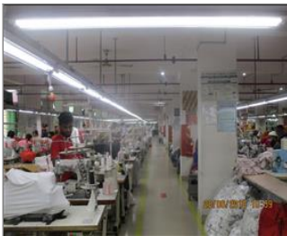
Photo of the inside of the main production hall Sewing section.JPG