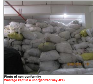
Photo of non-conformity Wastage kept in a unorganized way.JPG