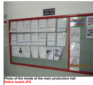
Photo of the inside of the main production hall Notice board.JPG