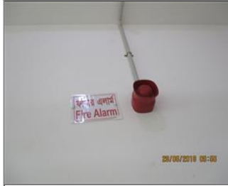
Photo of fire safety equipment Fire alarm.JPG