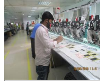
Photo of non-conformity Embroidery workers not using ear plug.JPG