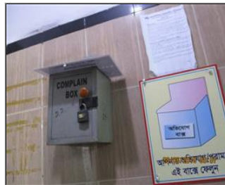
Photo of the inside of the main production hall Complaint box.JPG