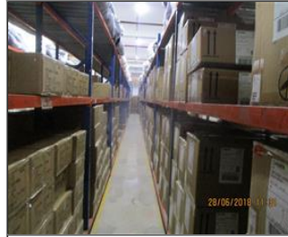
Photo of the inside of the main production hall Accessories store.JPG