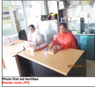
Photo first aid facilities Doctor room.JPG