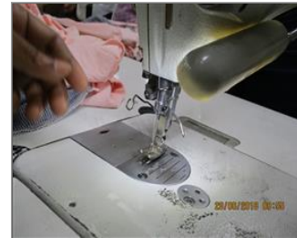
Photo of non-conformity Needle guard displaced at sewing machine.JPG