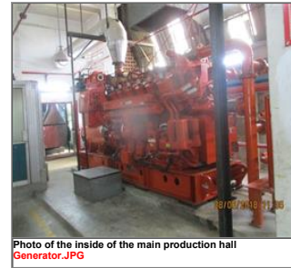
Photo of the inside of the main production hall Generator.JPG