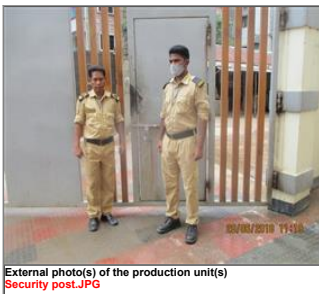
External photo(s) of the production unit(s) Security post.JPG