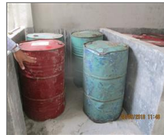
Photo of non-conformity No proper secondary containment with diesel.JPG