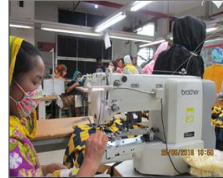
Photo of non-conformity Eye guard displaced at bartack machine.JPG