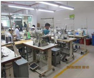
Photo of the inside of the main production hall Sample section.JPG