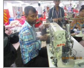
Photo of non-conformity Flat lock operator not using face mask.JPG