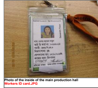
Photo of the inside of the main production hall Workers ID card.JPG