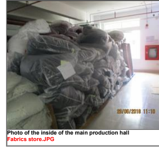
Photo of the inside of the main production hall Fabrics store.JPG