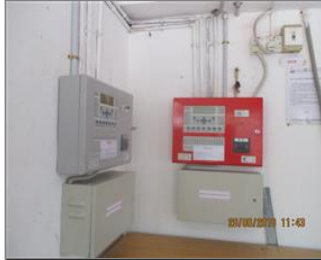
Photo of fire safety equipment Control panel.JPG