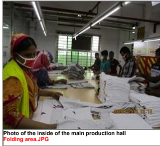
Photo of the inside of the main production hall Folding area.JPG