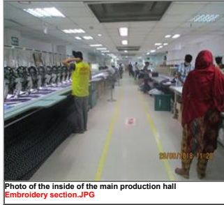
Photo of the inside of the main production hall Embroidery section.JPG