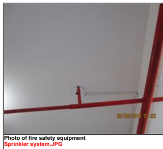
Photo of fire safety equipment Sprinkler system.JPG