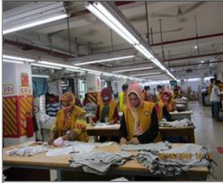
Photo of the inside of the main production hall Quality checking area.JPG