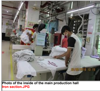
Photo of the inside of the main production hall Iron section.JPG