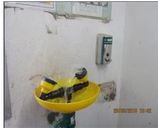
Photo of the inside of the main production hall Eye wash point.JPG