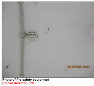
Photo of fire safety equipment Smoke detector.JPG