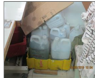
Photo of non-conformity No MSDS and label for machine oil.JPG