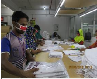
Photo of the inside of the main production hall Poly area.JPG