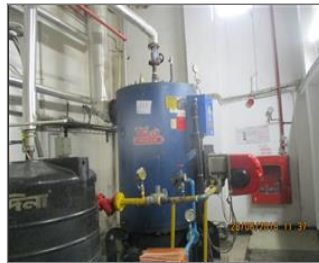
Photo of the inside of the main production hall Boiler.JPG