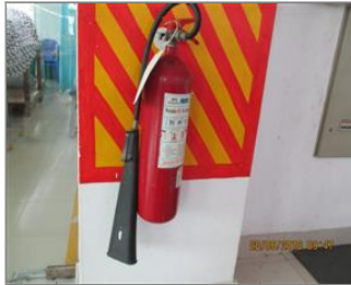
Photo of fire safety equipment Fire extinguisher.JPG